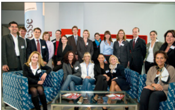
IMC Absolventen als Arbeitgeber bei Career Links 2009. Ein wirklicher Asset für die Studierenden.